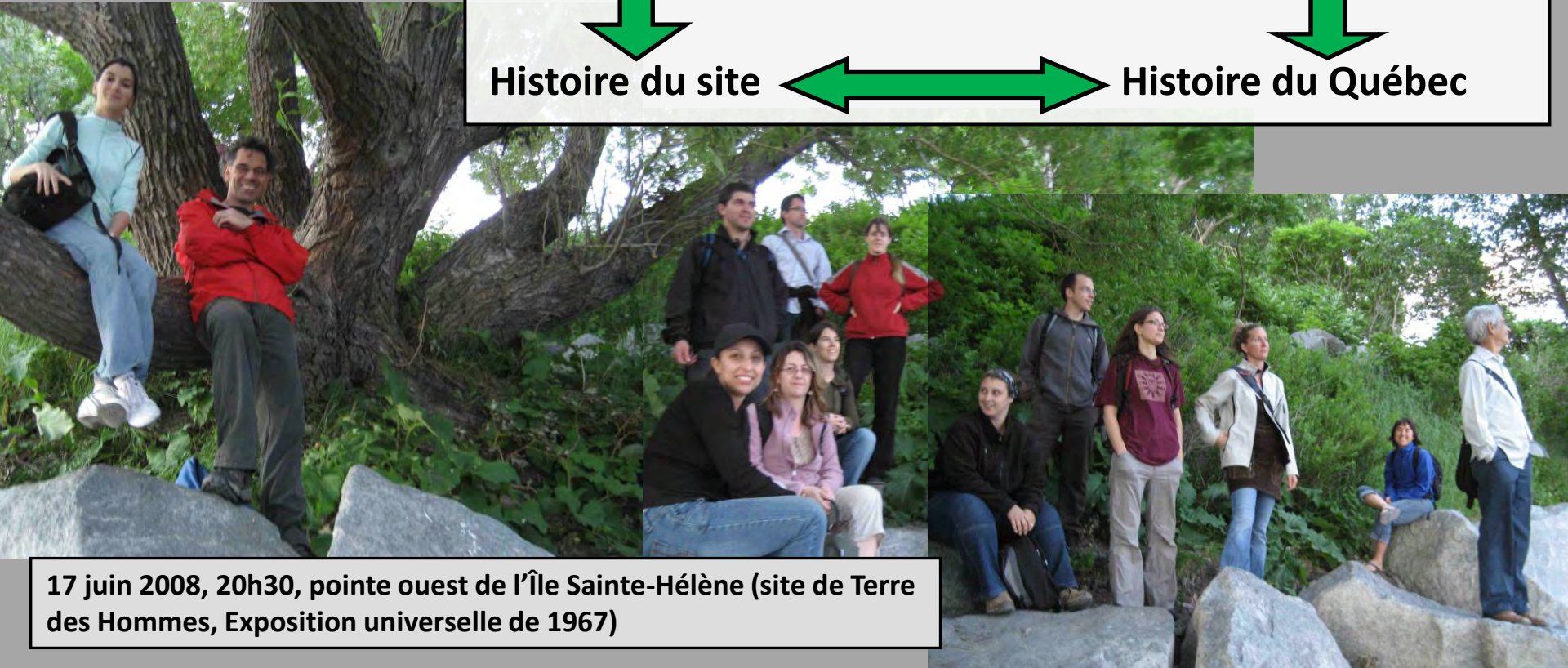
17 juin 2008, 20h30, pointe ouest de l'Île Sainte-Hélène (site de Terre des Hommes, Exposition universelle de 1967)

Il [le sociologue étasunien C. Wright Mills dans L'imagination sociologique ] nous rappelle que nous sommes tous plongés dans un mouvement historique, que les structures sociales résultent de luttes sociales ; que les grandes décisions politiques ont des conséquences sur notre vie quotidienne et le fil de nos existences, et que nous ne sommes pas complètement dépourvus de moyens de peser sur ces décisions. Il en tire une conclusion majeure, qui ne concerne pas seulement les sociologues, mais tous ceux et celles qui cherchent à comprendre le fonctionnement de leur société dans le but de la rendre meilleure : c'est au point exact où s'entrecroisent le mouvement historique, les structures sociales et la biographie qu'il convient de se placer.