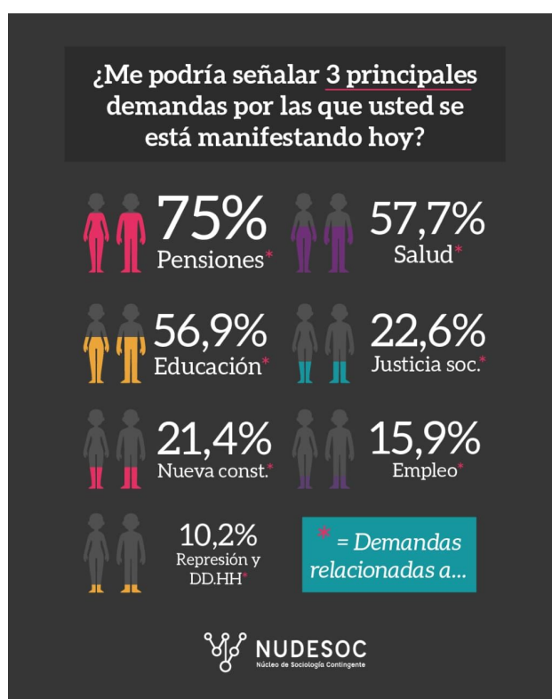
Figura 2. Principales demandas de l-s manifestantes.