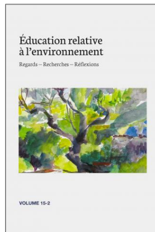
Illustration : Francine Labelle Couverture : L'amandier de Dominique (aquarelle)

Rappelons aussi que chaque couverture de la revue met en évidence l'œuvre d'un.e artiste.